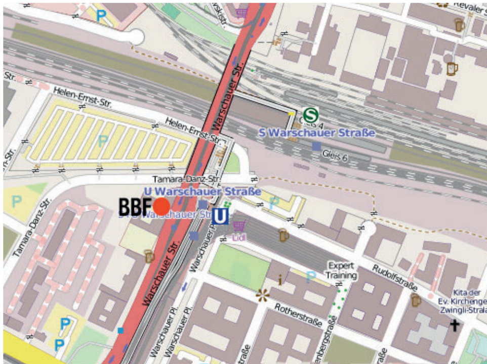
Karte erstellt mit OpenStreetMap, Open Database License (ODbL)